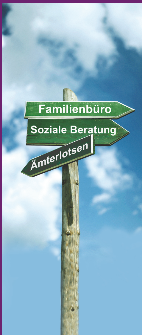
Stand: April 2026