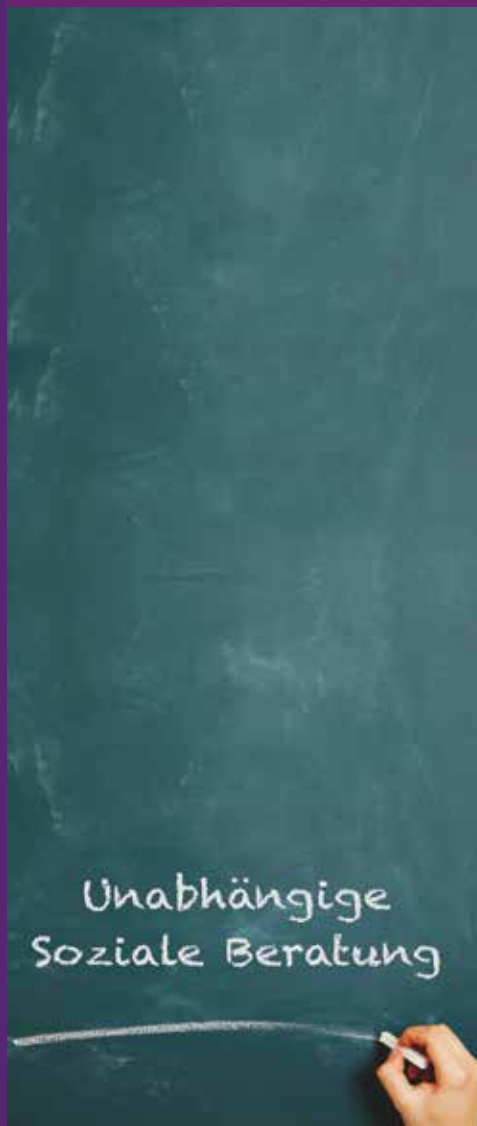
Stand: Oktober 2023